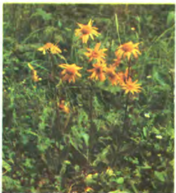
96. Арніка гірська.